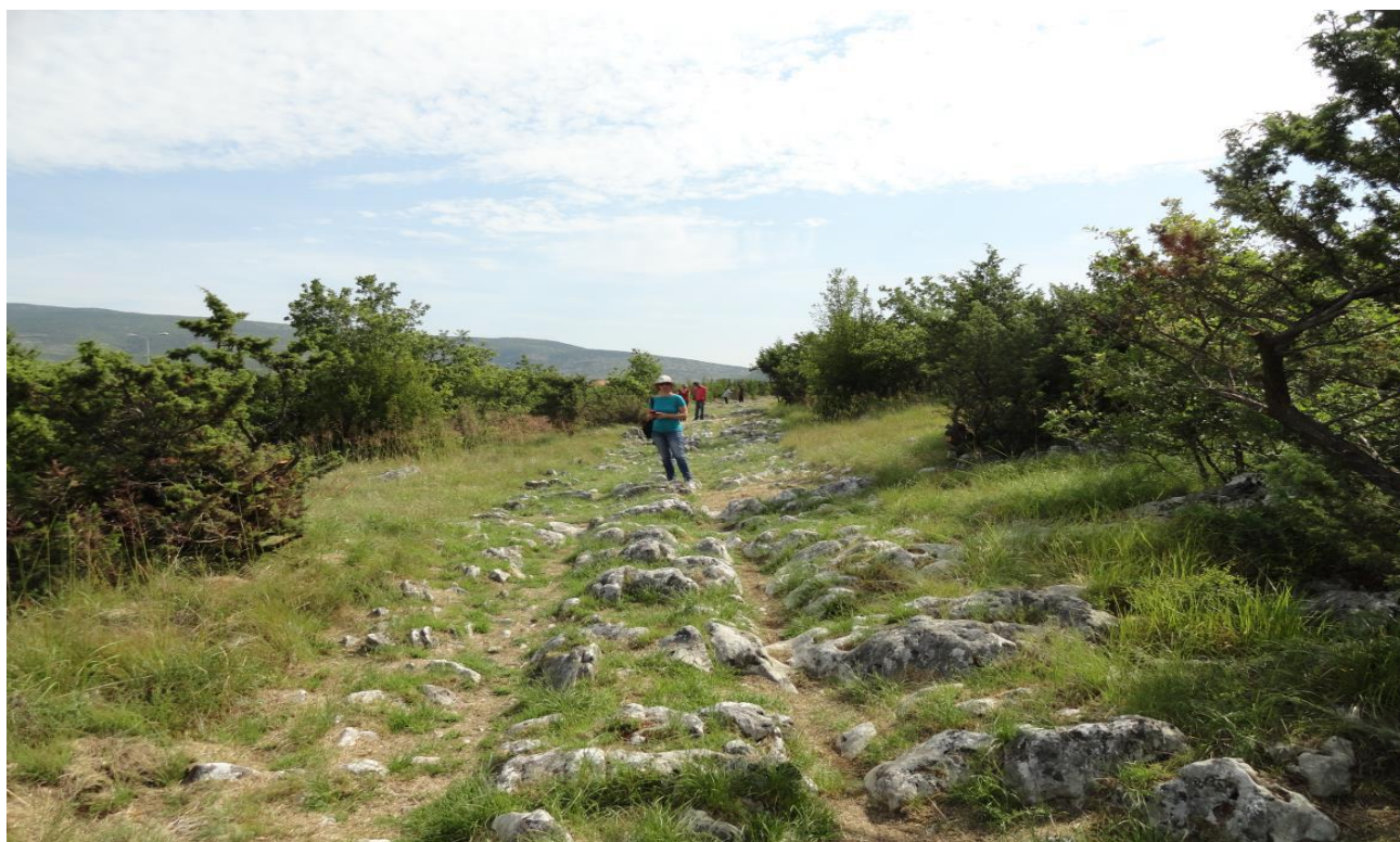
Antička cesta na području Općine Dicmo

U projekciji za 2026. godinu ukupni prihodi planirani su u iznosu od 7.960.422 eura, od čega su prihodi poslovanja planirani u iznosu od 5.204.208,11 eura, dok su prihodi od prodaje nefinancijske imovine planirani su u iznosu od 2.756.214,61 eura.