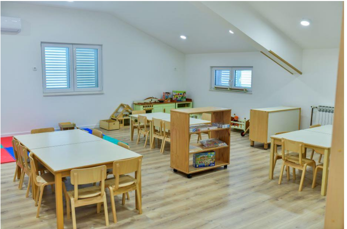
Rekonstrukcija općinske upravne zgrade na 1. katu za potrebe dječjeg vrtića. Svečano otvaranje