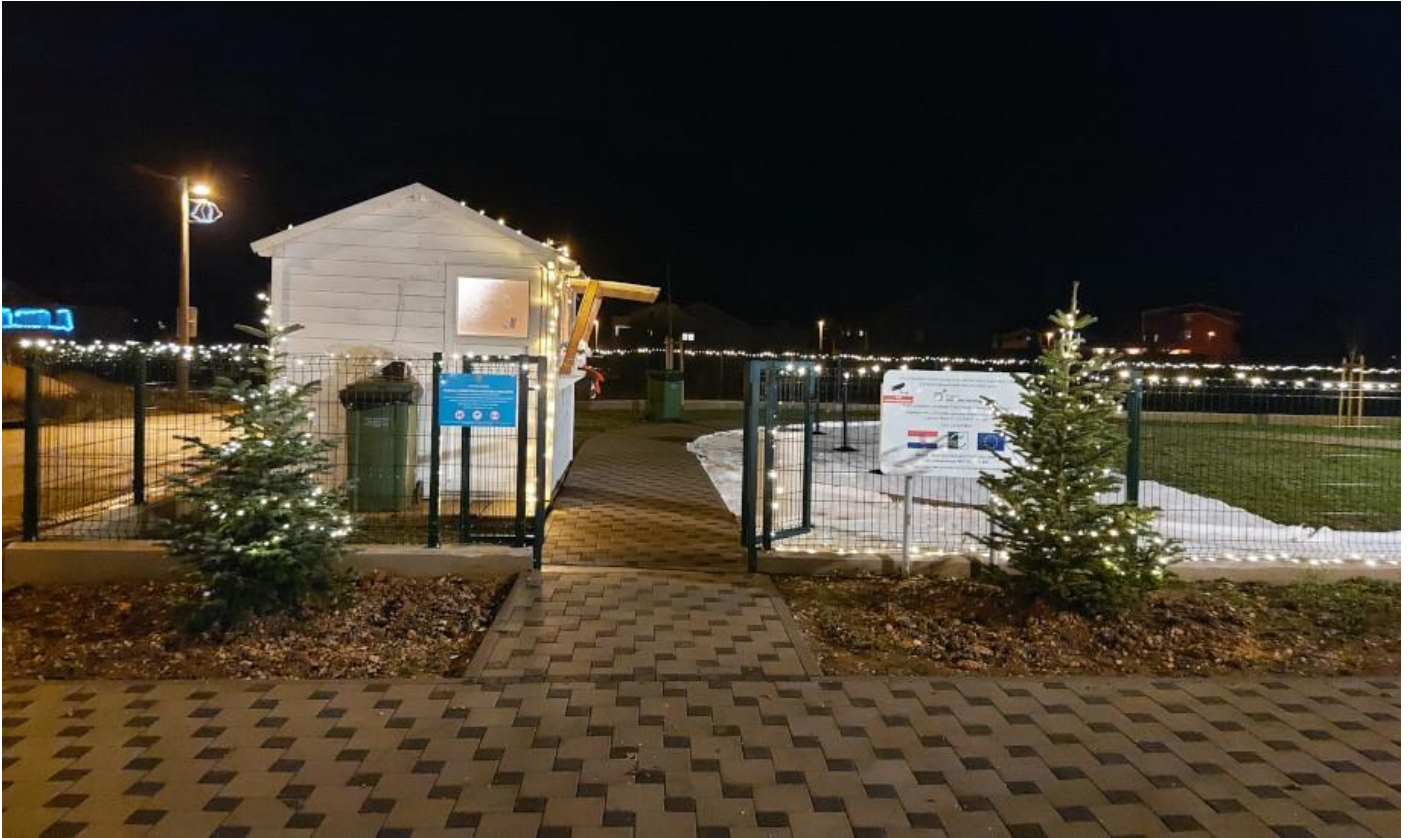
Zeleni park Dicmo