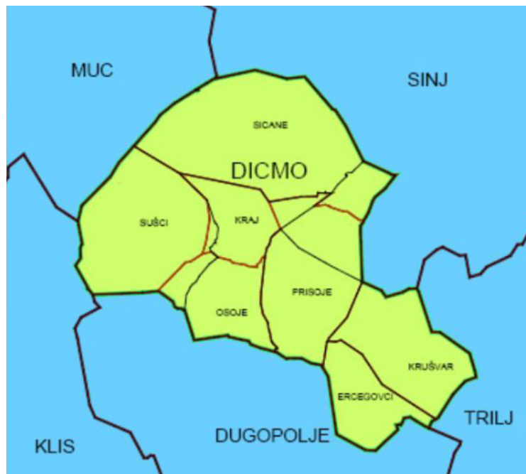
Slika 1: prostor Općine

Dicmo je i naziv za suho nizinsko polje u kršu dugo oko 15 kilometara od sjeverozapada (Donje Dicmo) do jugoistoka (Gornje Dicmo) široko 2,5 kilometara. Nadmorska visina mu je između 315 do 319 metara.